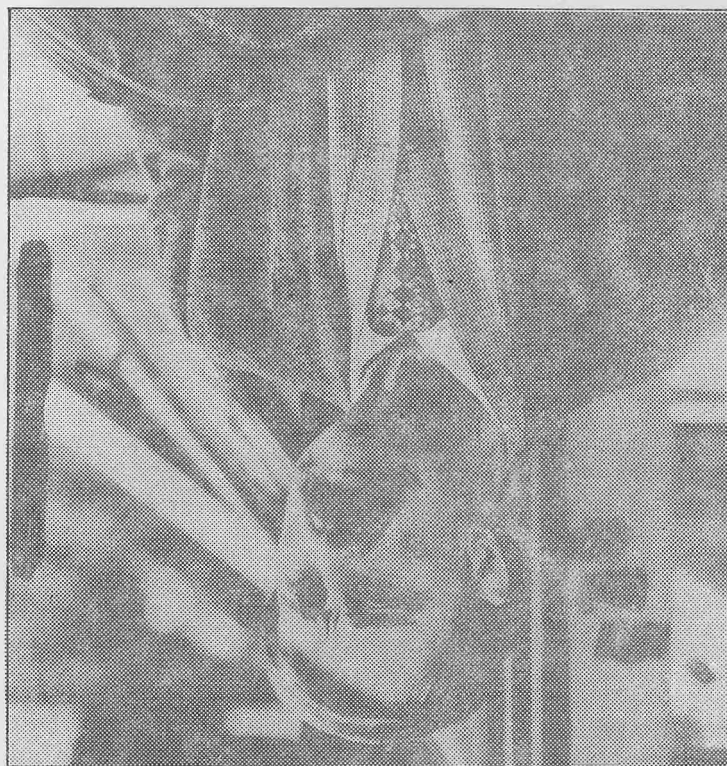
Kandyd w Chicago