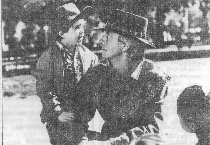
Pogoda dla krokodyli

Niemal każda kinematografia świata ma swoją narodową specjalność. Amerykanie - to ostatnio przede wszystkim wysokobudżetowe kino efektów specjalnych, Brytyjczycy - to tradycja nieco archaicznego kryminału i czarnej komedii itd.